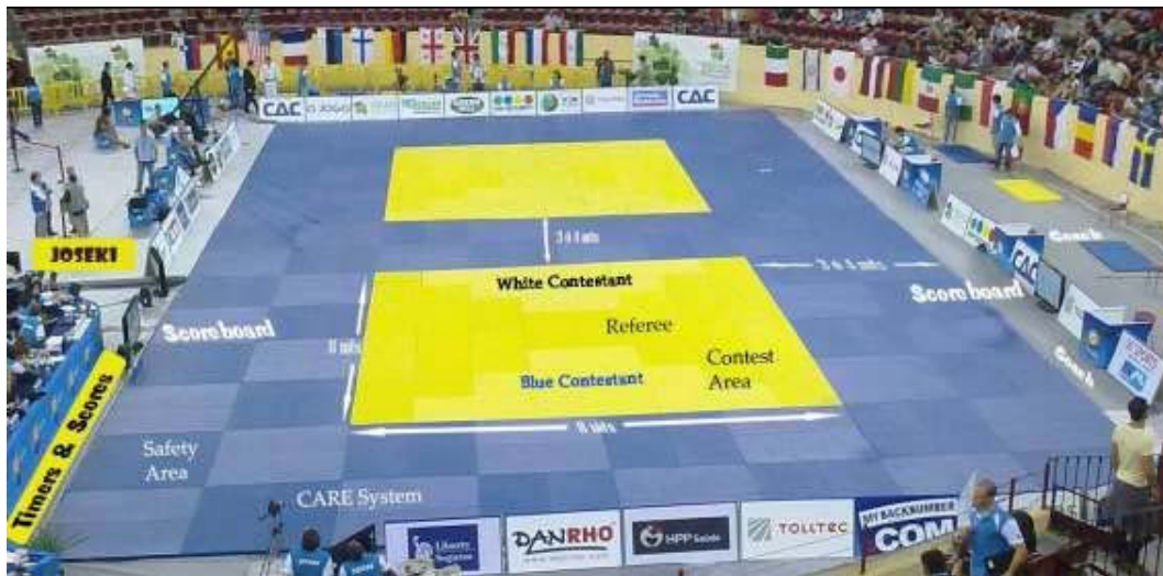
Abb. 2: Kampffläche